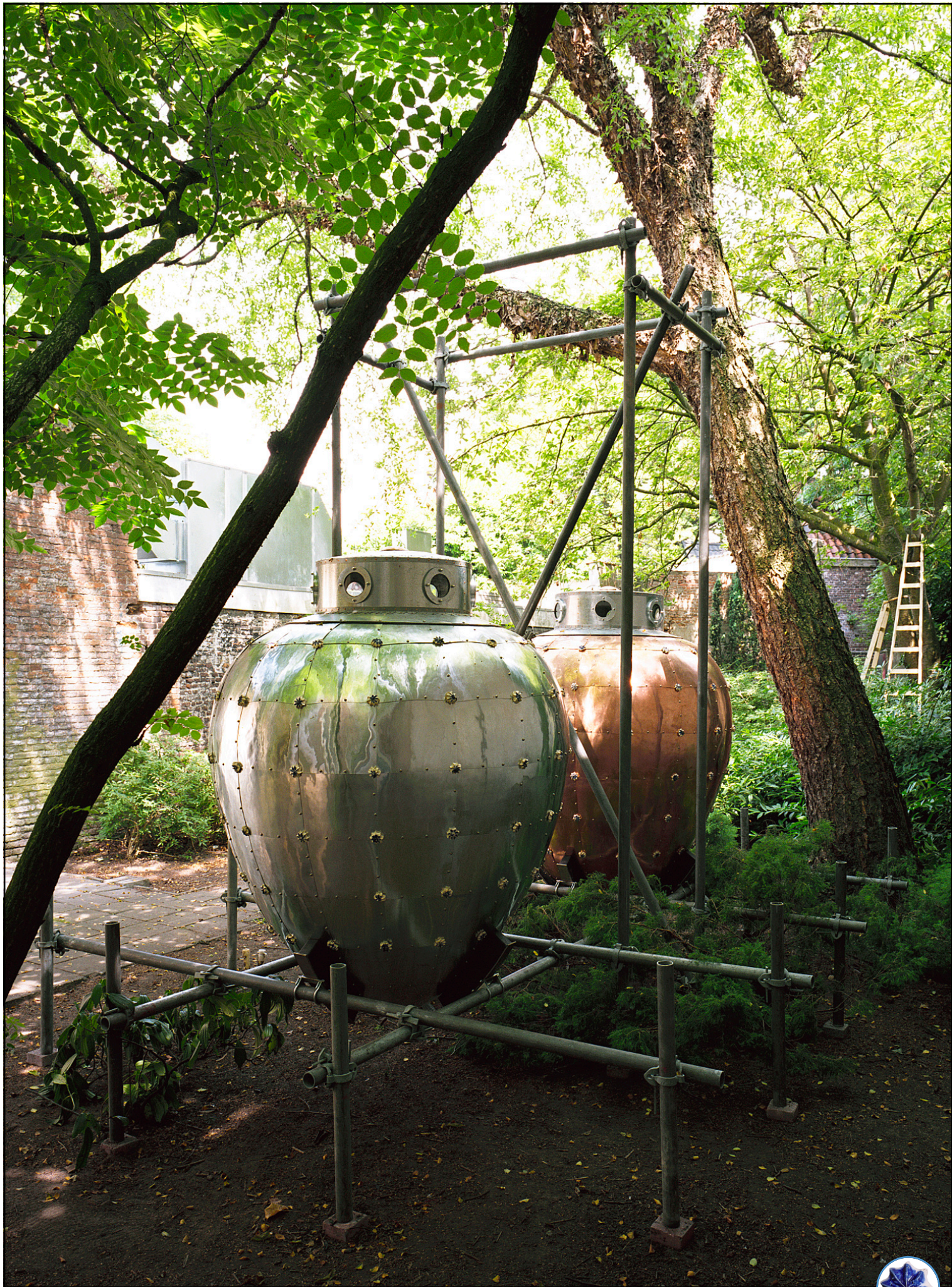
De installatie doet sommigen denken aan een groot peper- en zoutstel