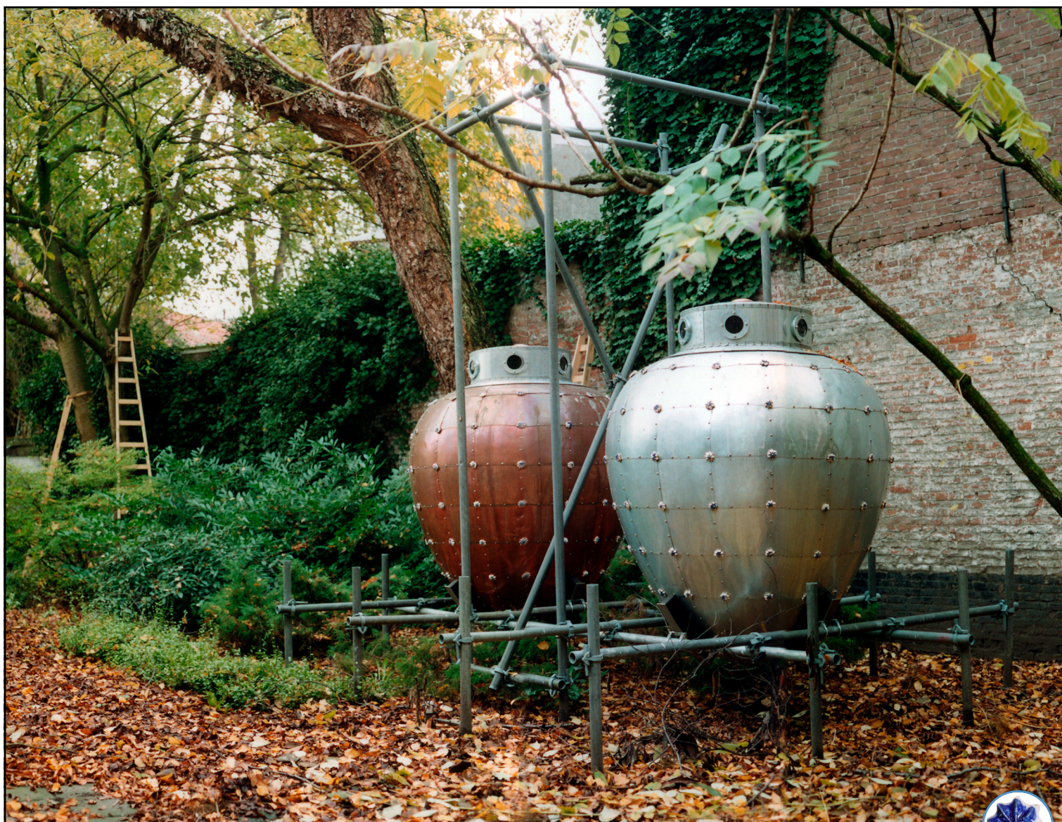
De twee beelden van koper en zink in een Bossche achtertuin in de herfst van 2001

Op de foto zien we een Bossche achtertuin in 2001. Twee bijna identieke bollen staan losjes opgesteld op een ijzeren constructie als in een soort lanceerinstallatie, klaar voor hun luchtig vertrek. Het geheel doet sommigen ook denken aan een groot peper- en zoutstel.